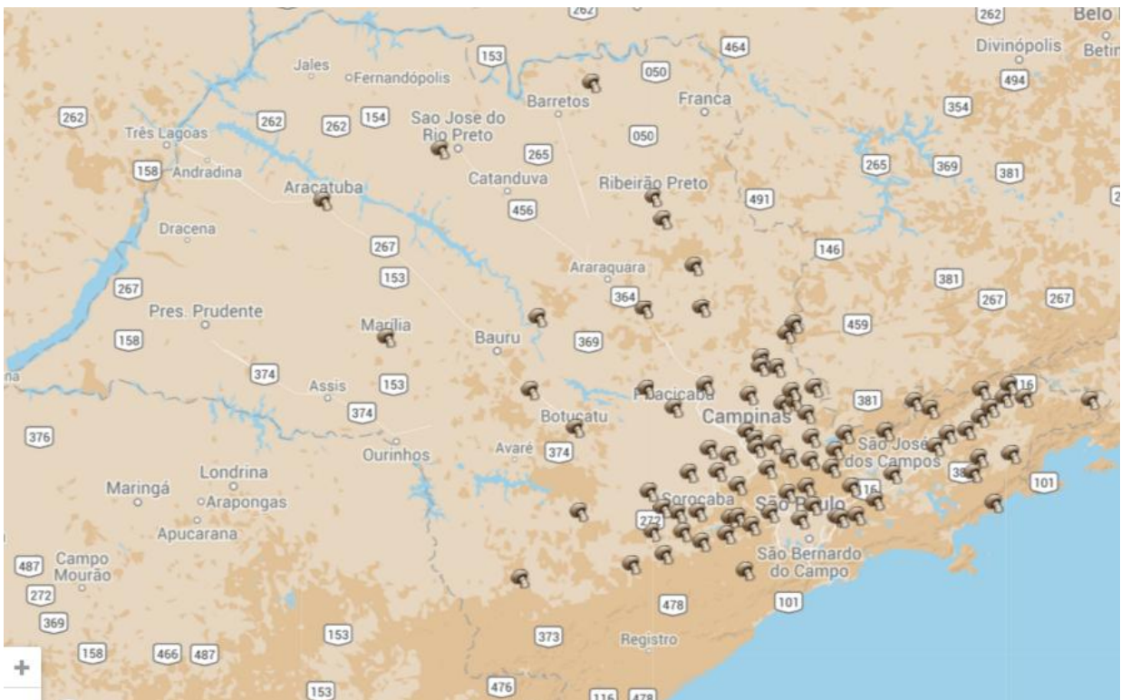
Figura 2 – Mapa (Google Maps) municípios produtores de cogumelo no Estado de São Paulo.

A somatória dos cogumelos produzidos pelos 505 produtores é de 1.062,008 toneladas de cogumelos mês, gerando uma receita na ordem de R$ 21.240.017,00 mensais e cerca de 5000 empregos diretos.