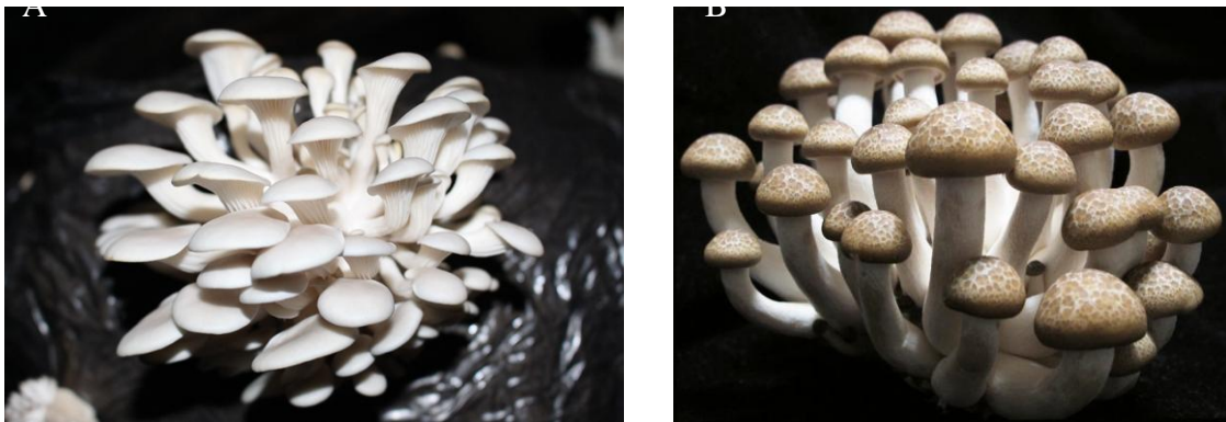
Figura 3. A) Pleurotus Ostreatus ; B) Hypsizygus marmoreus

Na produção de cogumelos do gênero Pleurotus (coloração branca, preta, salmão e amarela) os números destacaram, 24,55% dos produtores, sendo que, apenas no Brasil estes cogumelos são denominados como “Shimeji”, no resto do mundo são denominados de “Oyster mushroom” ou “cogumelo ostra” sendo o verdadeiro Shimeji o cogumelo Hypsizygus marmoreus (Figura 3).