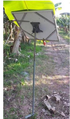
Figura 2. Pedestal flexível em altura e declividade, desenvolvido para aplicação de fungicida protetor e sistêmico na extremidade direita e superior de folhas de bananeiras.