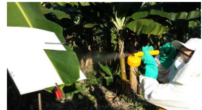
Figura 3. Aplicação de fungicida protetor e sistêmico, com auxílio do delimitador, na extremidade direita superior da folha nº1 e folha nº2 de bananeiras.

Após as aplicações, as cinco lesões em estágio 1, que foram demarcadas em cinco folhas nº 2 de cinco plantas, totalizaram 25 lesões para cada tratamento, e passaram a ser avaliadas semanalmente, durante seis a oito semanas, quanto à evolução dos estádios de desenvolvimento dos sintomas, com base na escala descritiva, desenvolvida para esse fim ( Tabela 1 e Figura 4 ). Ao final deste período, pode-se observar que as lesões demarcadas em folhas que não receberam nenhum tratamento adicional (tratamento testemunha) atingiram o estágio mais avançado de desenvolvimento dos sintomas (estádio 6).