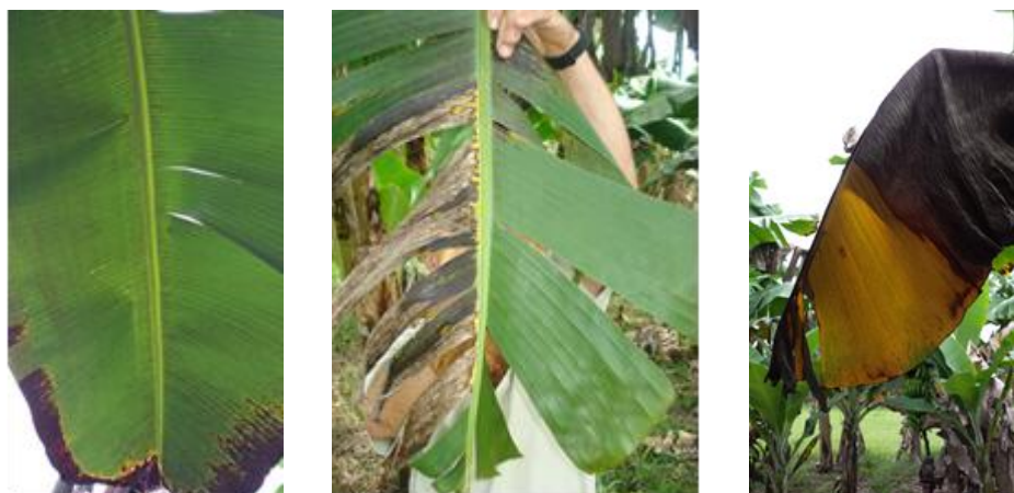
Figura 5. Severidade da sigatoka negra em folha de bananeira Nanica 'Grand Naine' tratada e não tratada com fungicida protetor (à esquerda) e sistêmico (no meio), oito semanas após a aplicação; e folha tratada em processo de senescência natural, dezesseis semanas após a aplicação (à direita).

quanto na porção marginal da folha que cresceu ou se expandiu após oito semanas de uma única aplicação, demonstrando o maior período residual e translocação marginal desses fungicidas pelo fluxo da transpiração, não havendo necessidade de reaplicação na mesma folha até sua senescência e morte, mesmo que ocorra o crescimento do tecido foliar.