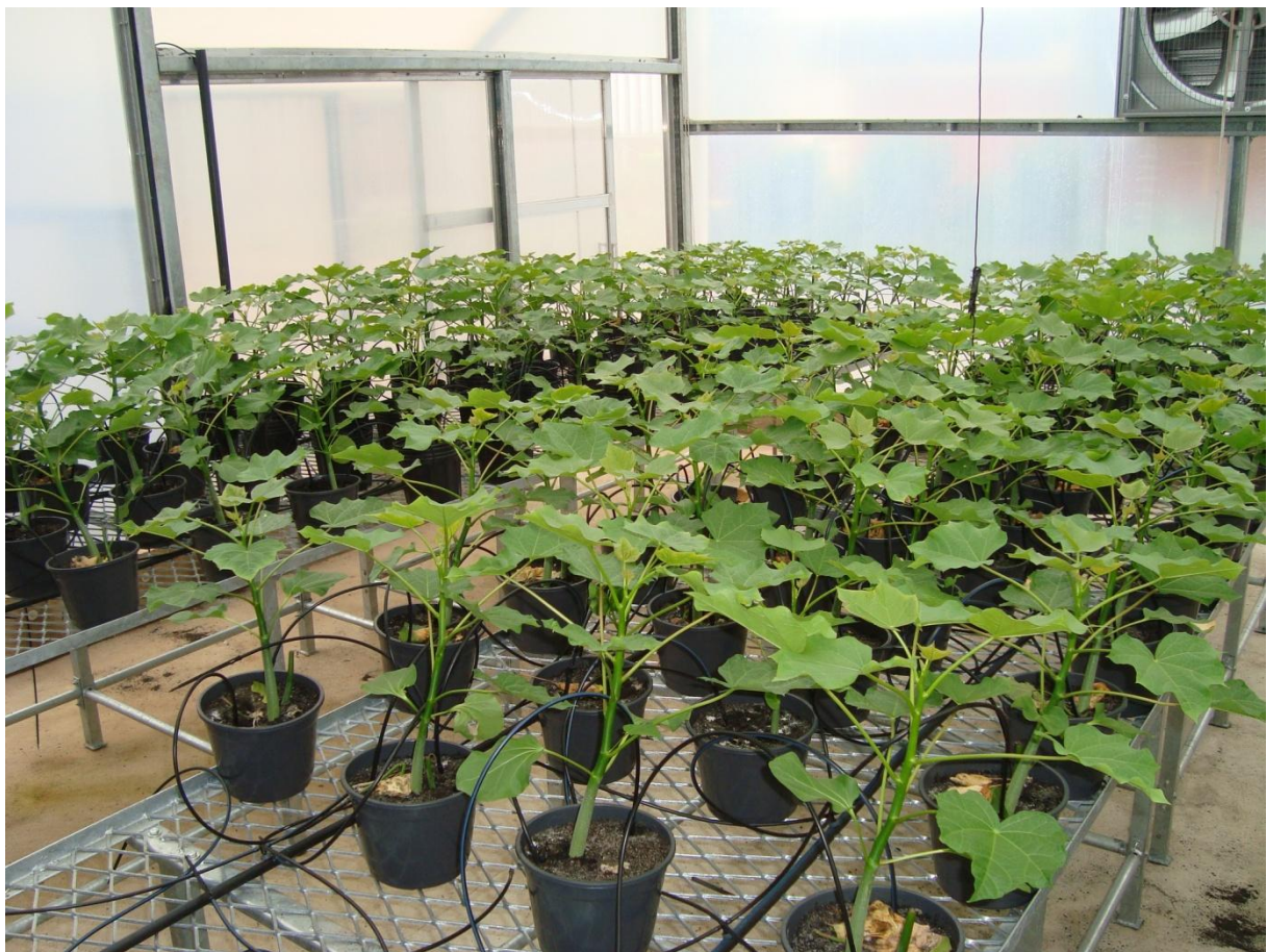
Figura 1. Plantas de pinhão-manso cultivadas em casa-de-vegetação, uma semana antes da inoculação de P. jatrophiicola .

O aparecimento dos sintomas da ferrugem do pinhão-manso variou entre 8-12 dias, sendo observados inicialmente nas folhas mais novas das brotações.