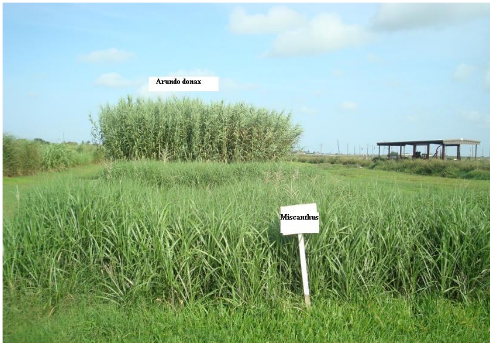
Figura 2. Parcela com miscanthus em primeiro plano e Arundo donax (atrás).