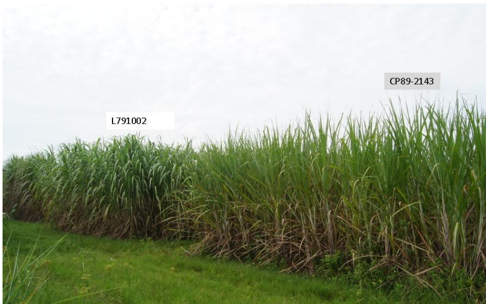
Figura 1. Variedade de cana-de-açúcar CP89-2143 e clone de cana energia L79 1002.

pior opção para a região foi miscanthus. Arundo donax tem alta produção inicial de biomassa, atingindo cerca de 28 t/ha de matéria seca no mês de junho, contra cerca de 10 t/ha para as demais culturas. Em agosto, capim elefante e arundo lideraram com pouco mais de 40 t/ha de matéria seca, contra cerca de 25 t/ha da cana, cana energia e erianthus. Já nessa época, miscanthus não acrescentou mais biomassa do que havia sido observado no mês de junho. Essa foi a época de pico da produção de biomassa de capim elefante. A partir desse período a produtividade dessa planta manteve-se ou mesmo decresceu um pouco. Já Arundo donax , cana de açúcar, cana energia e erianthus, tiveram biomassas crescentes até o último período de avaliação, onde Arundo donax e a variedade de cana CP89 2143 não apresentaram diferenças estatísticas na produtividade, liderando as demais. Vale lembrar que estamos avaliando apenas a biomassa, sendo que a cana e a cana energia têm considerável teor de açúcares, enquanto que as demais plantas têm maior concentração de celulose e outras fibras. Essas diferenças na qualidade da biomassa, ou na energia primária de cada planta, não são computadas na avaliação simples da quantidade de massa produzida.