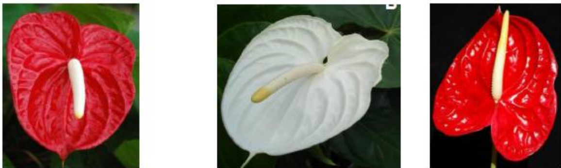
Figura 3. Principais cultivares em cultivo comercial no Brasil. A: 'IAC Eidibel'; B: 'IAC Luau'; C: 'Apalai'.

Dentre as cultivares brasileiras de antúrio, a 'IAC Eidibel' destacou-se em relação às demais por seu formato, cor e brilho e, atualmente, é a mais cultivada no Brasil. Outras cultivares largamente cultivados no Brasil são: IAC Luau e Apalai (Figura 3).