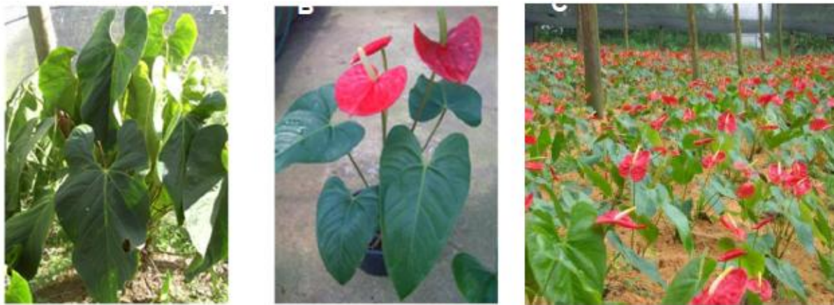
Figura 2. Classes de utilização de plantas de antúrio. Paisagismo (A), de vaso (B) e de corte (C).

constituída de plantas compactas, folhas com verde-escuro intenso e grande quantidade de pequenas hastes florais, utilizadas para decoração de interiores (Figura 2B). A terceira classe, constituída por plantas vistosas, sendo que suas hastes florais são utilizadas para decoração de ambientes e arranjos, e se caracterizam por produzirem espatas grandes, vistosas e coloridas (Figura 2C).