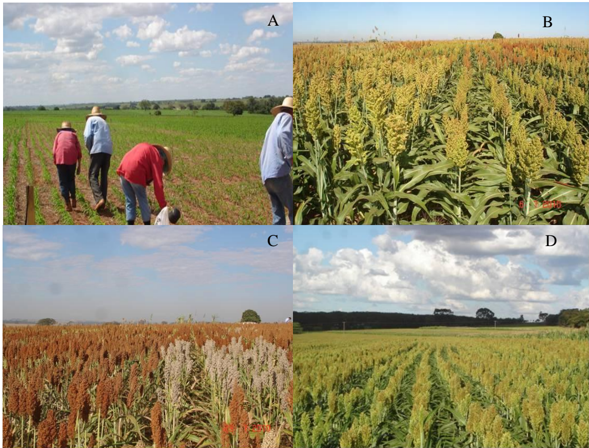
Figura 2. Vista geral do Ensaio instalado em Birigui-SP, em diferentes fases do desenvolvimento da cultura (A, B, C) e do Campo experimental - Apta Noroeste Paulista, Votuporanga-SP (D), 2010.

O desempenho diferenciado de muitas cultivares de sorgo avaliadas é caracterizado pela interação genótipo x local. Desse modo, a avaliação das cultivares gera informações preciosas para o produtor que pode escolher aquelas que apresentam melhor desempenho em seu sistema de produção. Na análise conjunta das cultivares avaliadas, observa-se que muitas podem ser utilizadas com segurança na região (Quadro 3).