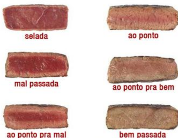
Figura 1. Escala de gradação de ponto cozimento de carne.

Foram utilizados TABLETS de 7 polegadas como instrumentos de coleta ao invés de formulários em papel, sendo os dados armazenados no dispositivo e posteriormente transmitidos para banco de dados (computação em nuvem). Este recurso facilitou o uso de figuras em alta definição para a indicação visual de preferências dos consumidores.